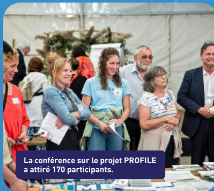
La conférence sur le projet PROFILE a attiré 170 participants.

SoMe (Social Networks and Mental Health)