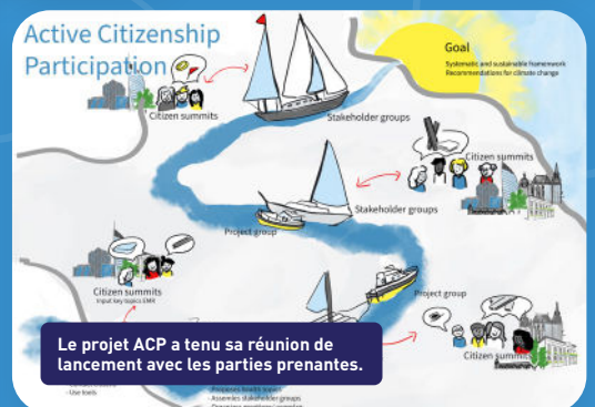
Le projet ACP a tenu sa réunion de lancement avec les parties prenantes.