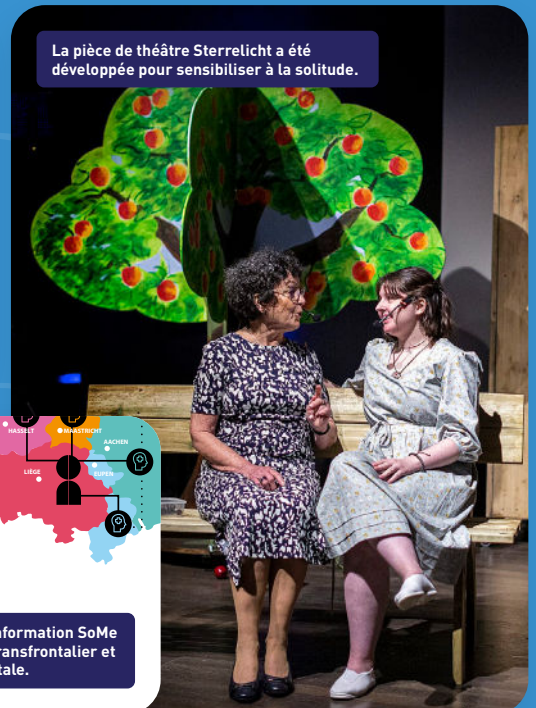
La pièce de théâtre Sterrelucht a été développée pour sensibiliser à la solitude.