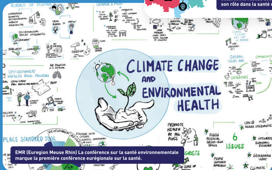
EMR (Euregion Meuse Rhin) La conférence sur la santé environnementale marque la première conférence eurégionale sur la santé.