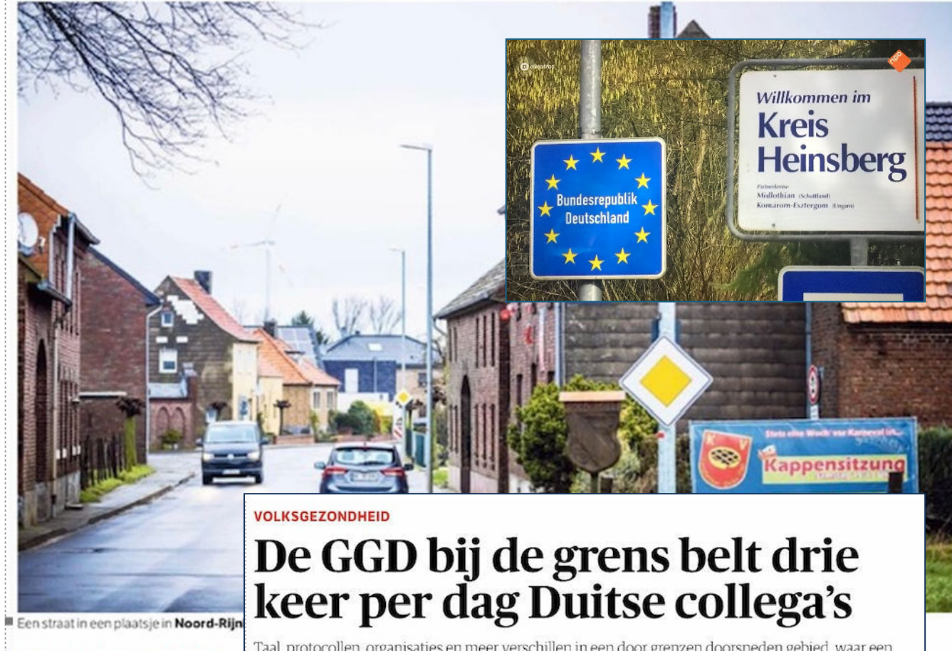
Een straat in een plaatsje in Noord-Rijn