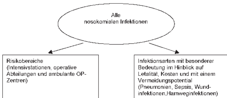
Abb. 1 ▲ Konzentration auf Risikobereiche und Risiko-NI-Arten